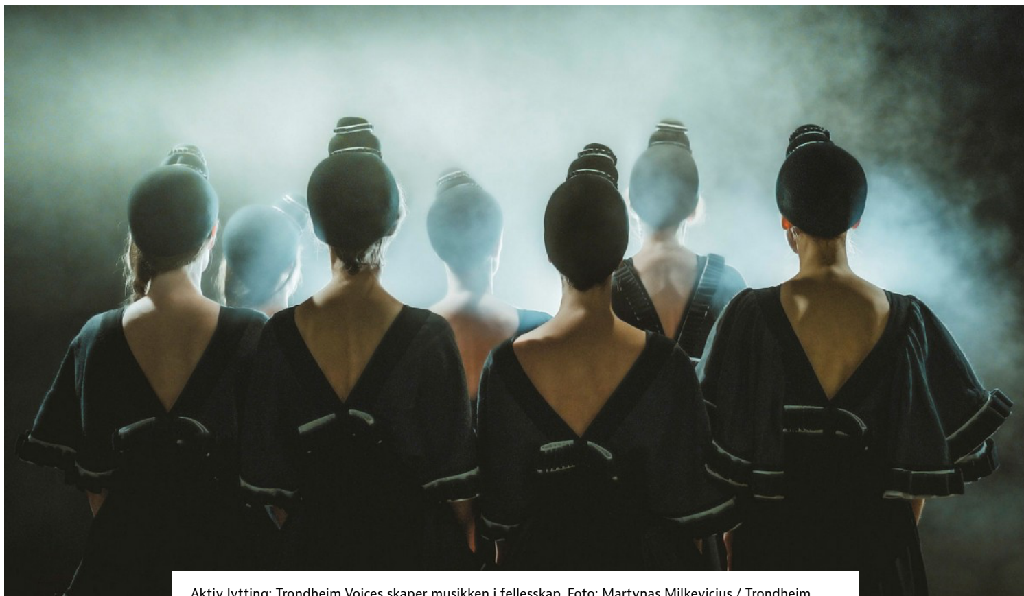
Aktiv lytting: Trondheim Voices skaper musikken i fellesskap.

Ekstremt gode lyttere finner veier til nye verdener.